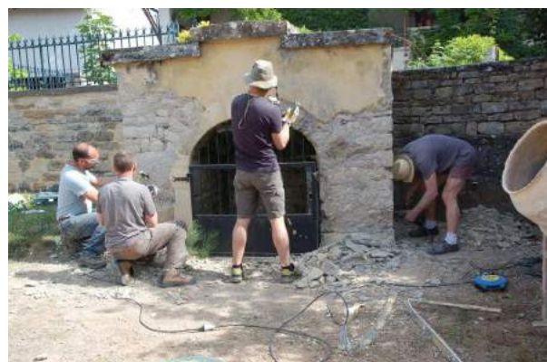
Réfection du puits

Le Dimanche 31 mai une petite équipe de courageux a entrepris le ravalement du puits situé derrière le lavoir de la