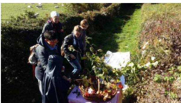
Chasse aux merveilles